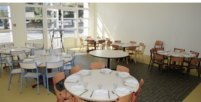
▲ SITE DAMIEN MADESCLAIRE