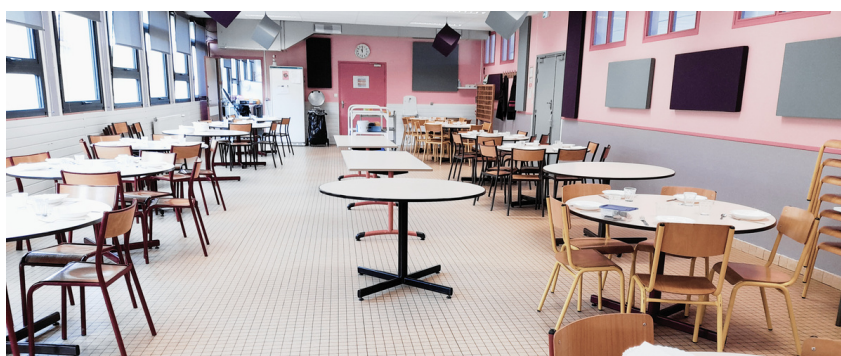
▲ SITE DE BEYNE

Dans le cadre du Règlement Européen sur la protection des données (RGPD) 2016/679, les informations recueillies sont nécessaires au respect d'une obligation légale à laquelle le responsable du traitement est soumis. Ces informations sont conservées durant toute la période de fréquentation des activités par l'enfant puis archivées pour une durée maximum de 10 ans. Les justificatifs nécessaires à l'inscription ne sont pas conservés au-delà de la période de fréquentation. Vous pouvez exercer vos droits d'accès et rectification auprès du délégué à la protection des données de la Mairie d'Égletons, enregistré auprès de la Commission Nationale Informatique et Libertés sous la référence DPO-97091. Formulaire de contact sur www.gaiacconnect.fr