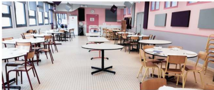
▲ ÉCOLE DAMIEN MADESCLAIRE